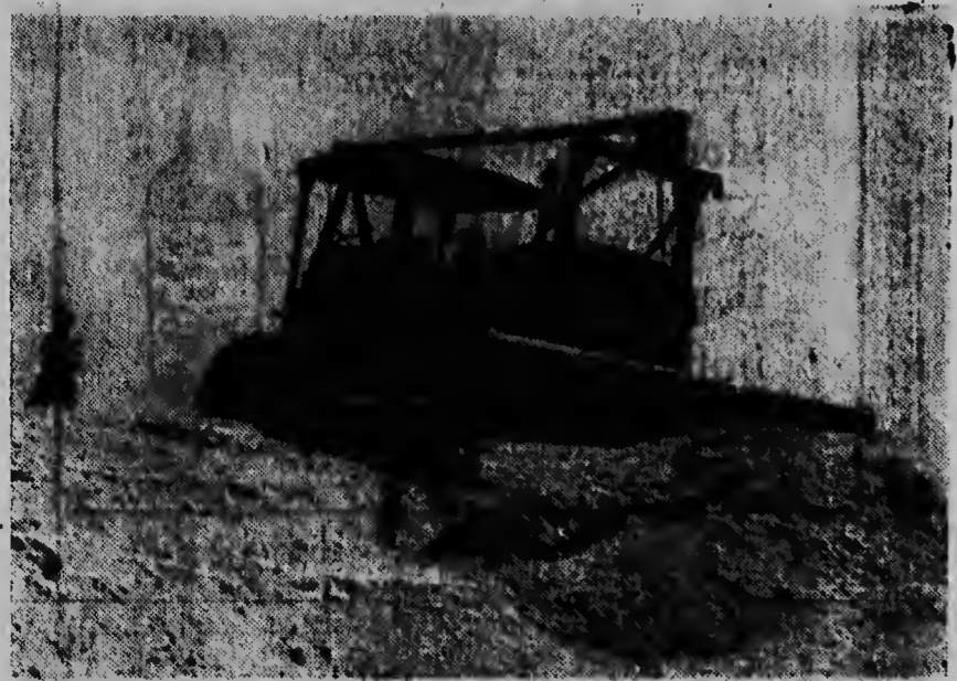
Despues cu e parti mas ariba duro a worde dinamita y hiba efor, nan ta basha riba e terreno santu, cual na cierto punto nan ta un paar di meter haltu. Esaki ta e terreno caminda e bulldozernan awor ta trahando duro.